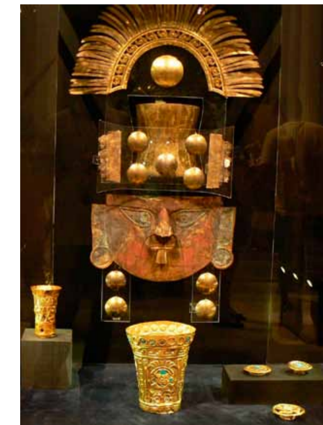
Комплекс украшений, размещенных в погребении на голове и лице умершего. Культура ламбайеке. Museos "Oro del Perú" "Armas del Mundo" Fundación Miguel Mujica Gallo

ным активом, поскольку не было подвержено коррозии и уничтожению. Золото является одним из первых используемых человеком метал-