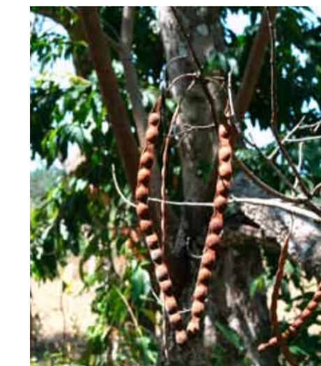
Anadenanthera peregrina. Современное фото

Инки жевали листья коки (или куки — в языке кечуа о и у не различаются). Этот кустарник растет на небольших высотах в теплых долинах. Листья коки являются бодрящим средством при усталости или голоде, они предотвращают судороги и появление язв. Для извлечения активных веществ листья жуют вместе с известью. Кокаина сырые листья не содержат, поэтому от употребления коки индейцы не делались наркоманами. Вместе с тем частое употребление коки истощает организм. После прихода испанцев коку жевали индейцы, которых заставляли работать в серебряных рудниках. Эти люди могли не принимать пищу по несколько дней, но долго не жили. Индейцы использовали коку не столько как стимулянт при тяжелом труде, сколько в ритуальных целях. Ее жевали во время любых социально значимых церемоний и встреч. На сосудах культуры мочика, относящихся к III-VI векам н.э., часто изображены люди с мешочками ли-