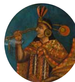
4. Майта Капак