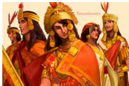
Древнеперуанская знать. Современная реконструкция

История инков и доинкских цивилизаций с их верованиями и представлениями, которые столь отличны от наших, до сих пор во многом загадочна и рассказана не до конца. Результаты новых исследований, открытие новых объектов и артефактов позволяют глубже заглянуть в мир андской культуры, который мы хотели бы оживить на выставке.