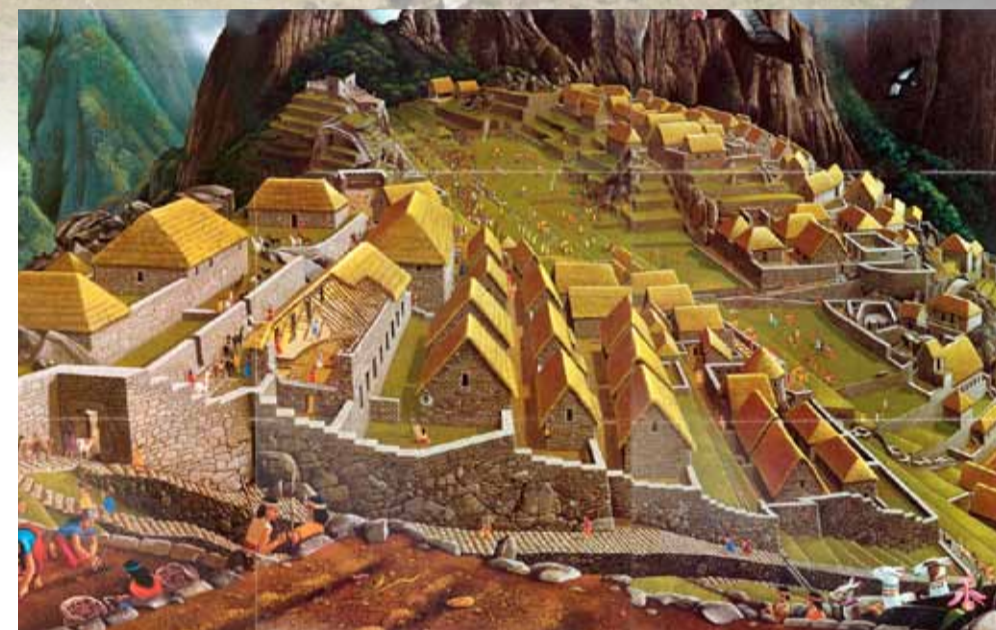
Мачу Пикчу. Современная реконструкция