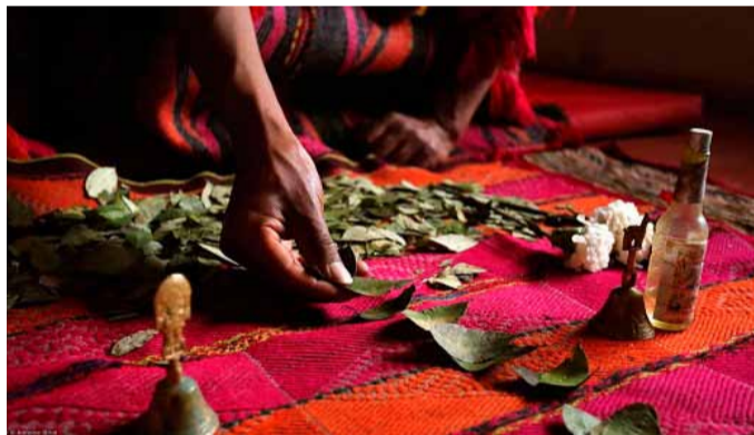
Листья коки. Современное фото

жен он был не в состоянии. А вот если в поле работают голодные рты. Центральные Анды обладали настолько разнообразными пищевыми ресурсами, что в обычное время голод населению не грозил. Чего не хватало — так это стабильности. Землетрясения, цунами, эль-ниньо, продолжительные засухи — подобные бедствия были непредсказуемы и могли закончиться катастрофой. Археологические исследования показывают, что население отдельных районов порою быстро росло, а порою едва ли не вымирало.