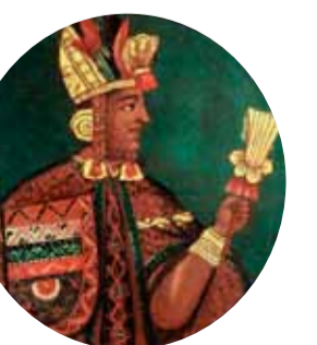
9. Пачакути Инка Юпанки