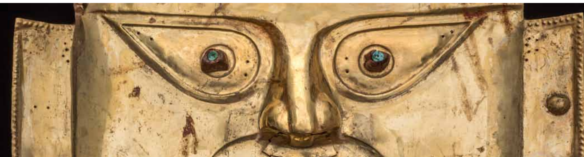
Погребальная маска. Культура ламбайеке