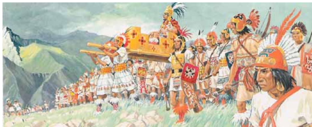
Армия инков во главе с императором. Современные реконструкции

Население обязано было служить в войске, принимать участие в горных работах, постройке укреплений, дворцов, дорог и мостов и, разумеется, заниматься земледелием либо рыбной ловлей, разведением лам и т.п. Служащие контролировали порядок ведения работ. Жрецы содержались за счет государства. Инка,