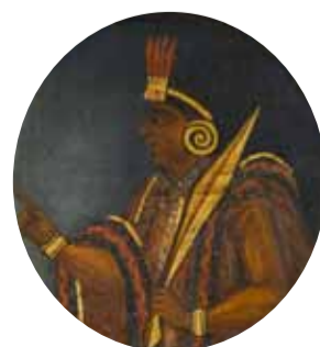
2. Синчи Рока