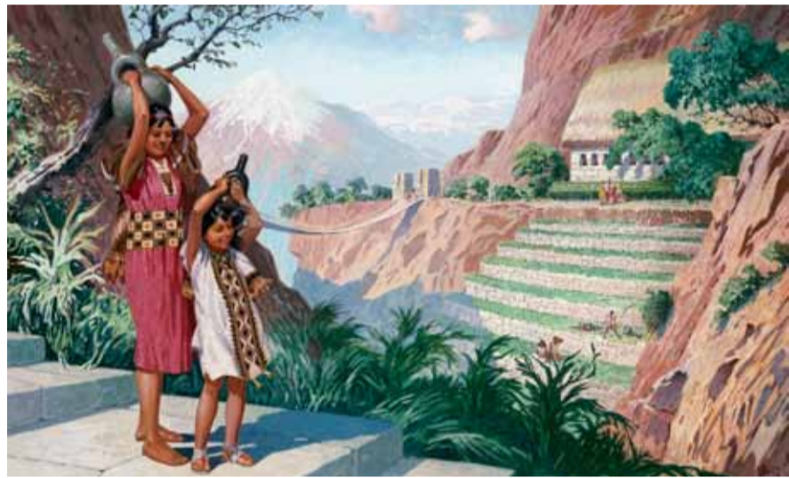
Почвы Анд плодородны, но здесь рельеф сильно изрезан. Растения чаще всего выращивали на искусственных террасах, покрывавших горные склоны. Современная реконструкция

Как и во многих обществах, включая некоторые существующие до сих пор, в государстве Инков люди не были свободны, планируя свою личную жизнь. Вступление в брак являлось обязательным, а безбрачие запрещалось, поскольку государство не должно было испытывать недостатка в рабочих и воинах. Оно было заинтересовано в рождении детей, а плодovitая женщина пользовалась уважением. Рождение ребенка ожидали с нетерпением, а мать близнецов считалась находящейся под покровительством сверхъестественных сил. Индейская женщина обычно рожала там, где ее застали схватки, и почти без болей — во всяком случае она работала до последнего мгновения. Она сама перерезала пуповину и омывала ребенка в ближайшем ручье, при этом согревала воду во рту. После завершения омовения мать клала новорожденного в заранее подготовленную легкую колыбель, представлявшую собой перевязь через плечо. В ней ребенок оставался первые месяцы своей жизни. Жесткие предписания, которые регулировали в том числе самые интимные области жизни, запрещали матери брать ребенка на руки. Иначе он слишком при-