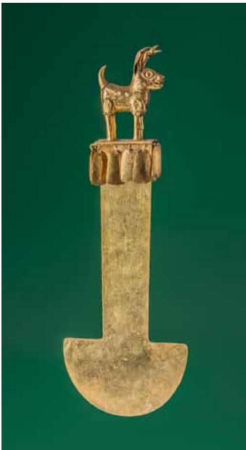
Нож туми. Культура ламбайеке Museos "Oro del Perú" "Armas del Mundo" Fundación Miguel Mujica Gallo