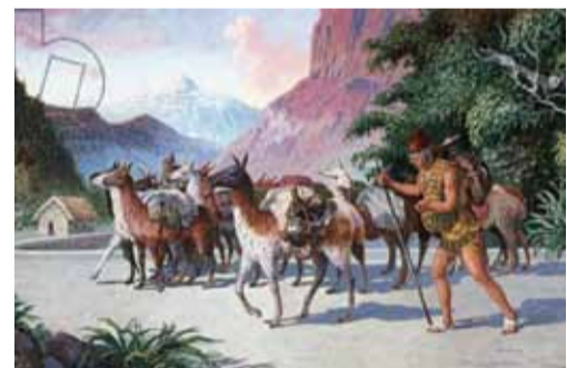
М. Херберт. Древнеперуанские пастухи лам

Альпака – родственник ламы, вероятно, происходящая от дикой викуны. Система кровообращения этой «андской овцы» приспособлена к жизни на большой высоте, а нежные копытца – к мягкой и хорошо увлажненной почве высокогорной пуны. В отличие от ламы, альпака плохо себя чувствует в низменностях, поэтому ее трудно увидеть в зоопарках. Альпака никогда не являлась существенным источником мясной пищи, но зато шерсти она дает в восемь раз больше, чем лама. Эта шерсть – великолепного качества и слегка уступает лишь шерсти викуны. Здесь заключается принципиальное различие между альпакакой (и даже ламой) и овцой. Дикая овца не имела шерсти, а шкуру ее покрывали жесткие волосы. Настоящая шерсть появилась у овцы лишь в IV тысячелетии до н.э., постепенно развившись из подшерстка.