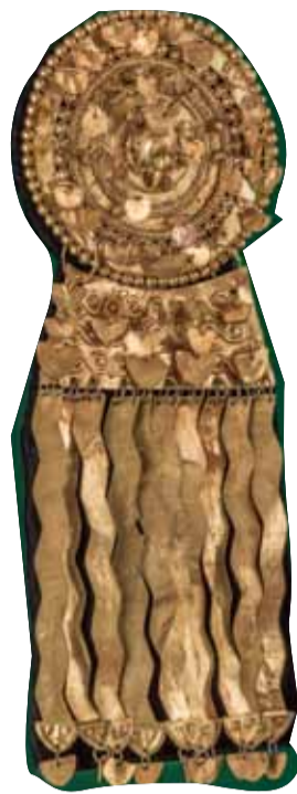
Пара золотых ушных украшений. Культура фриас. Museos "Oro del Perú" "Armas del Mundo" Fundación Miguel Mujica Gallo

лов, уступая только меди. Оно отождествлялось с вечностью, властью, богатством. Обычно золото добывали при промывке речного песка, но уже в 2000 году до рождения Христа египтяне добывали золото в шахтах.