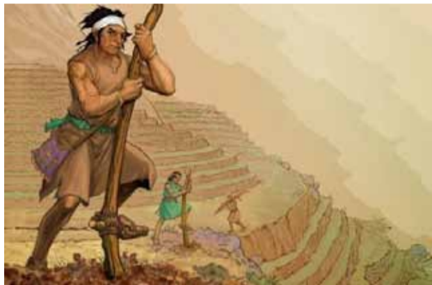
Бездействие является серьезным преступлением в уголовном праве инков. Современная реконструкция

- инкские бегуны-курьеры, или часки, носили специальную одежду и дежурили на своего рода станциях у дорог. Станции (танбо, тампу) располагались на таком расстоянии одна от другой, чтобы курьер мог с максимальной скоростью добежать до соседней и передать сообщение. Благодаря подобной системе, обмен информацией в государстве Инков осуществлялся невероятно быстро;