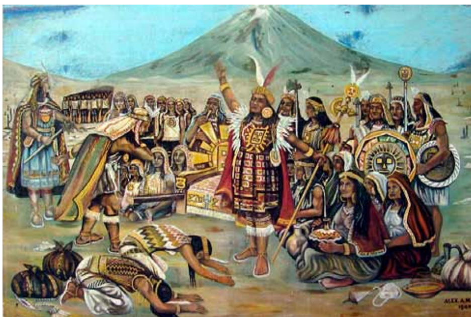
Южноамериканский поклоняется империи инков и преподносит дань. Современная реконструкция

Свое государство инки называли «Тауантинсуйу», что означало «четыре четверти» или «четыре области». Имелись в виду не четыре стороны света, а скорее четыре четверти, на которые делилась крестьянская община. Самое удивительное в том и состоит, что, создавая свое государство, инки воспользовались приемами, выработанными для управления жителями небольшой