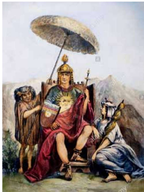
Король инков на троне. Фотогравюра конца XIX века

Формально культуру инков можно отнести к бронзовому веку, но любое сравнение с Древним Египтом, Шумером или Китаем поверхностно и неточно. Благодаря уникальной организации и продуманной системе обмена информацией, продуктами и людьми, инкам удалось управлять государством, которое было небообразно огромным по меркам древних цивилизаций Старого Света. В начале XVI века инки владели территорией от центрального Чили до южной Колумбии, протянувшейся с севера на юг на четыре тысячи километров. Это как минимум вчетверо больше, чем Древний Египет. Население Египта в эпоху строительства больших пирамид было примерно таким же, как и население Центральных Анд в XVI веке, но люди там обитали более компактно и поэтому управляли ими было