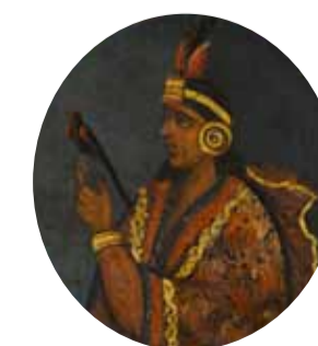
5. Капак Юпанки