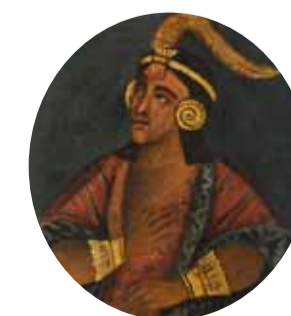
6. Инка Рока