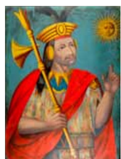
1. Манко Капак