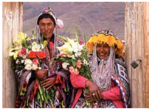
Свадьба. Современное фото

Что касается самого брака, то он позволял молодому человеку избавиться от власти родителей. Юноша получал собственное жилище, участок земли и право на получение помощи от общины. Брак нельзя было расторгнуть. Заключение брака завершалось пиром, предполагавшим употребление алкоголя. Самым ценным его видом считалось кукурузное пиво (или