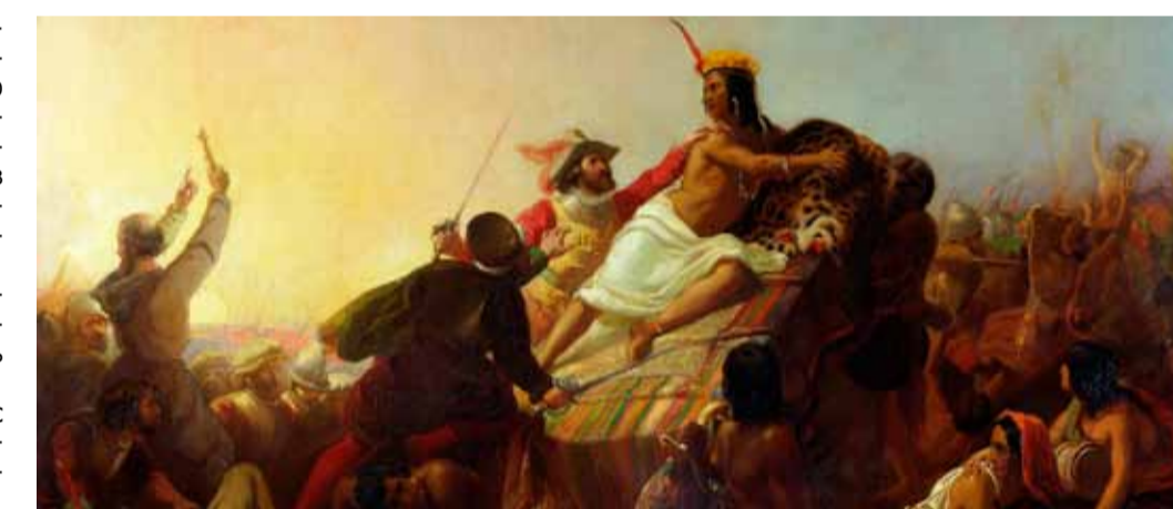
Д.-Э. Милле. Писарро захватывает в плен правителя инков Атауальпу. Деталь. 1845

Сейчас многим трудно себе представить, что народ, которому не были известны ни колесо, ни лошадь, ни письменность, создал империю, равную по протяженности римской (хотя по числу жителей уступавшей ей примерно в шесть раз). Парадокс инков — в сочетании архаических методов организации и управления, которые больше подходят для племенных вождей, и размеров империи, функционировавшей вполне эффективно. Счастливым случаем, эпидемии и передовые военные технологии помогли испанцам (многие из которых не умели даже читать и писать) покорить могущественную империю инков. «Плюющиеся огнем» ружья и навешивающие ужас всадники обеспечили Франсиско Писарро перевес, позволив победить превосходящие силы инков и взять в плен их правителя Атауальпу. После того как испанцы получили огромное количество золота в качестве выкупа, они убили последнего правителя империи инков Атауальпу. Никогда в истории человечества столь малочисленному войску не доставалась такая добыча. Но следует помнить, что встреча испанцев и инков не была просто столкновением двух империй. Умест-