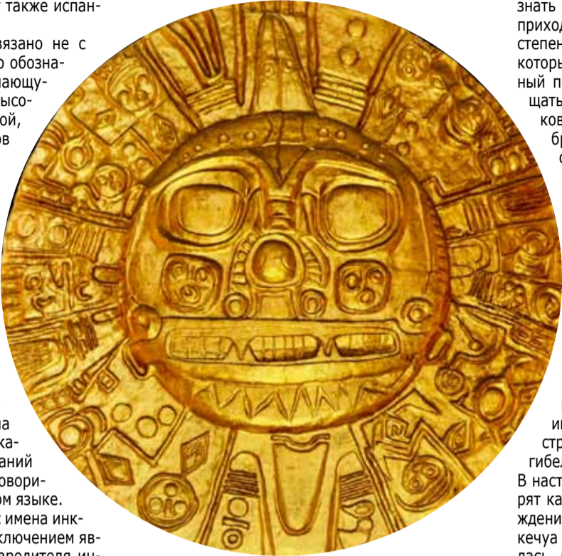
Золотая реликвия инков в Национальном музее Лимы в Перу

Важнейший эпизод в истории государства Инков связан с их победой над народом чанка, вторгнувшись в долину Куско с запада. Исконные земли чанка находились близ современного города Аякучо, то есть там же, где за 900 лет до этого была построена столица государства Уари. Что же касается долины Куско, то нет оснований полагать, что начале XV века они говорили не на кечуа, а на каком-то другом языке. Во всяком случае дошедшие до нас имена инкских правителей – кечуанские. Исключением является лишь имя мифического прародителя инков – Манко Капака. Сами инки утверждали, что