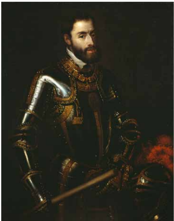
Карл V Габсбург – Император Священной Римской Империи, король Испании

Откуда взялось название «Перу» в точности не известно – возможно, от Виру, одной из прибрежных долин. Кроме королевского разрешения, Писарро получил также титул наместника королевства, которое намеревался присоединить к испанской короне. Он посетил свой родной город Трухильо, чтобы собрать там свою команду. К нему присоединились его единокров-