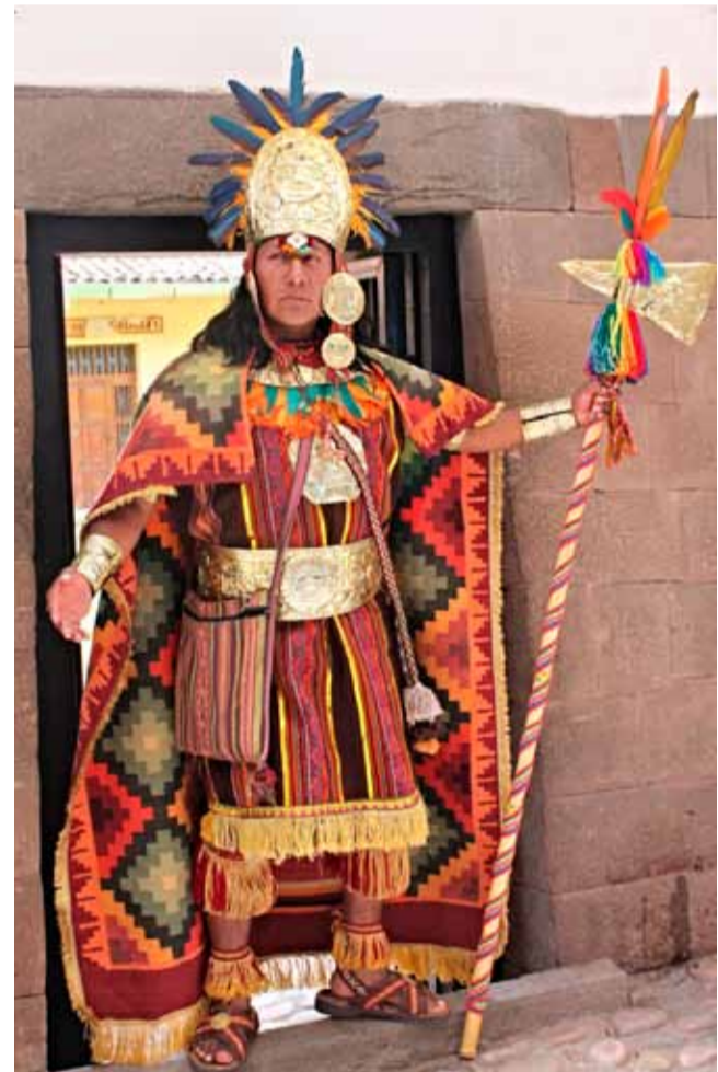
Парадное облачение царствующих инков было пестрым. В отличие от создателей более ранних цивилизаций Перу, инки украшали одежду лишь геометрическими узорами, но не изображениями божеств и животных. Современная реконструкция

В Старом Свете золото рано стало эквивалентом стоимости и использовалось для обмена и торговли. Обладание золотом являлось важнейшим способом упрочнения власти. В культурах Центральных Анд золото и власть тоже были неразрывно соединены, однако по другой причине. Эта связь возникла бла-