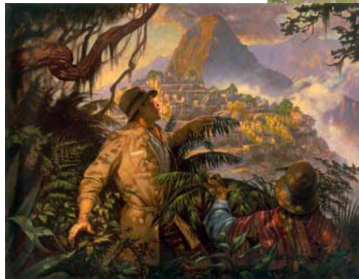
Томас Блэкшир. Хайрам Бингхем обнаруживает заброшенный город Мачу Пикчу в 1911 году

Мачу Пикчу означает «старая гора», хотя возможны и другие варианты перевода. Городок расположен в 80 км вниз по течению «священной реки» инков – Урубамбы, или Вильканоты, на высоте 2430 м. Слово «вилка» имеет отношение к сфере сакрального, в том числе к наркотике аяуаске. Местные индейцы всегда были осведомлены относительно развалин Мачу Пикчу, но европейцы долгое время о них ничего не знали. После того, как Куско оказался в руках испанцев, часть инкской знати бежала на северо-запад в труднодоступную горно-лесистую местность. Здесь они основали последнюю столицу инков Вилькабамбу, которая, однако, так и не была обнаружена. Ничего удивительного в