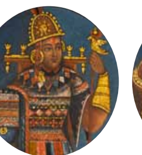
10. Тупак Инка Юпанки