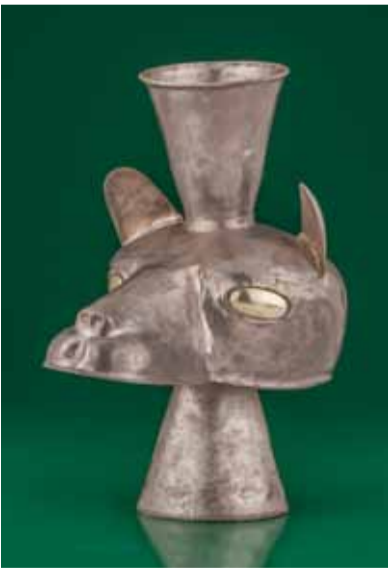
Сосуд в виде головы ламы Культура инков. Museos "Oro del Perú" "Armas del Mundo" Fundación Miguel Mujica Gallo

Но главная ценность ламы заключалась в ее способности перевозить грузы. Обычный самец ламы может переносить тяжести весом 40 кг, тренированный носильщик – примерно столько же. Однако лама питается подножным кормом, а носильщиков надо специально кормить. Переносить значительные по весу грузы с помощью носильщиков слишком затратно, тогда как караваны лам могли преодолевать сотни километров под наблюдением лишь небольшого числа погонщиков. Именно ламы позволили создать в Андах такую хозяйственную систему, при которой обмен продуктами осуществлялся централизованно. Здесь было экономически целесообразно перевозить на большие расстояния не только золото или ткани, но также картошку и кукурузу. В результате инки смогли контролировать снабжение городов и обеспечивать армию всем необходимым, заранее сосредоточив продукты на складах и распределяя их по мере необходимости. Без ламы инкское государство не могло бы существовать, а политическое и экономическое развитие Центральных Анд пошло бы по другому пути.