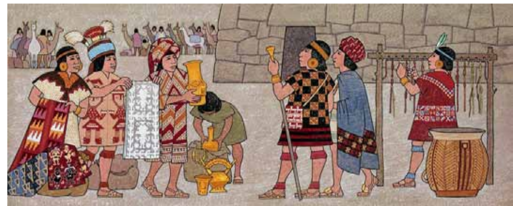
Узелковое письмо кипу использовали для подсчета различных изделий, которые производили ремесленники для нужд государства. Современная реконструкция