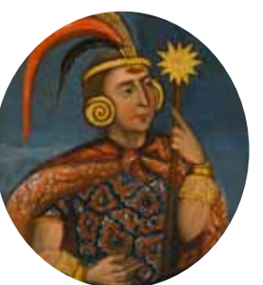
8. Виракоча Инка