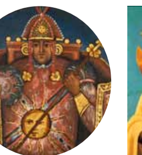
11. Уайна Капак