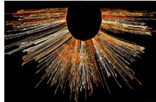
Узелковое письмо – кипу

- инки почитали солнце. Этому божеству приносили в жертву красивых и благородных девственников, которых воспитывали в так называемых монастырях, акляя уаши, «домах для избранных». Однако инки отказались от практики демонстративно жестоких и массовых казней пленников, что было характерно для ряда культур I тыс. н.э. Главным занятием акляя являлось изготовление тканей. Из акляя же выбирали наложниц для представителей знати.