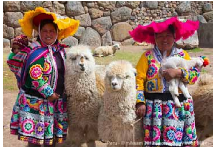
Саксайуаман, Куско, Перу. Современное фото

Что же касается альпаки, то для индейцев она является аллегорией прекрасной и нежной девушки и пользуется всеобщей любовью. Однажды при раскопках в низменностях Эквадора археологи обнаружили кости, которые принадлежали альпаке. Сообщение об этой находке было опубликовано под шуточным заголовком: «Что милая альпака вроде вас делает в подобном месте?» Позже решили, что кости все же принадлежат небольшой ламе. Ламы не только окружали обитателей Анд на земле. Если ночью они задирали голову и смотрели на небесную реку, которые европейцы называют Млечным Путем, они видели на ней темный силуэт. Это была небесная лама, протянув-