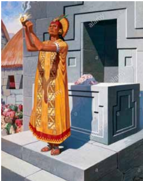
Верховный жрец Солнца держит ритуальную чашу. Современная реконструкция