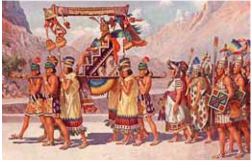
Во главе процессии на носилках несут Великого Инку. Современная реконструкция

16 мая. Из района близ современной границы с Эквадором Писарро направился вглубь Перу. Его сопровождали не менее двухсот пехотинцев и всадников, вооруженных пушками, арбалетами и аркебузами (короткоствольными ружьями). 15 ноября. Атауальпа с 50 000 воинами принимает посланников Писарро в своем лагере, расположенном в долине Кахамарка. Посланники сообщают, что они хотели бы предложить свои услуги могущественному правителю и научить