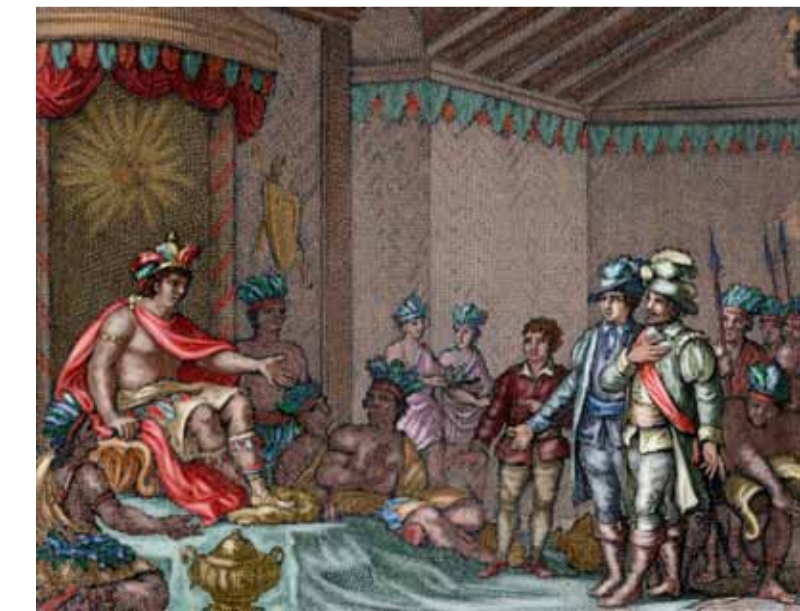
Представление испанского посла во главе с Франсиско Писарро и Эрнандо де Сото императору инков Атауальпе. Гравюра 1807 года

После того, как комната была заполнена золотом, конкистадоры разделили его между собой «по заслугам» (за вычетом одной пятой, принадлежащей королю Испании). Писарро отправляет