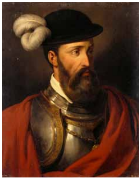
Конкистадор Франсиско Писарро – завоеватель Империи Инков