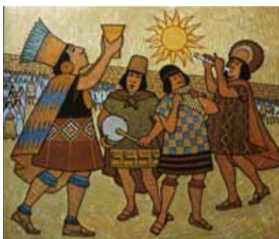
Поклонение солнцу в культуре инков. Современная реконструкция

Впрочем преувеличивать отличие индейцев от