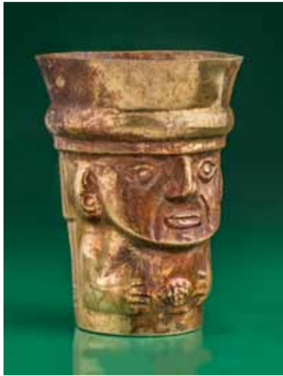
Кубок. Культура ламбайеке Museos "Oro del Perú" "Armas del Mundo" Fundación Miguel Mujica Gallo

В жизни индейцев Центральных Анд религиозные ритуалы не просто играли важную роль. Они лежали в основе организации общества. Древнеперуанские города возникали не на торговых путях, а вокруг культурных центров. Когда значение местного храма падало, город пустел, а когда росло, процветал. Столица государства, которому соответствует культура ламбайеке, представляла собой скопление гигантских монументальных платформ. Правитель и жрецов хоронили внутри платформ и снабжали множеством предметов из золота. Во время погребальных и поминальных ритуалов представители высшей знати чичу из золотых кубков. Некоторые из них достаточно велики по размеру. В более ранней культуре мочика жрецы и правители пили кровь пленников, поэтому в