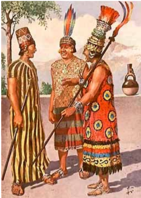
Знатные инки в парадных одеждах. Современная реконструкция

В настоящее время в Перу на языке кечуа говорят как некоторые люди европейского происхождения, так и индейцы. Однако попытка сделать кечуа одним из государственных языков не удалась. Диалекты кечуа распадаются на две группы и говорящие на них друг друга не понимают. Фактически языков кечуа два, и если сделать один из них государственным, то носители дру-