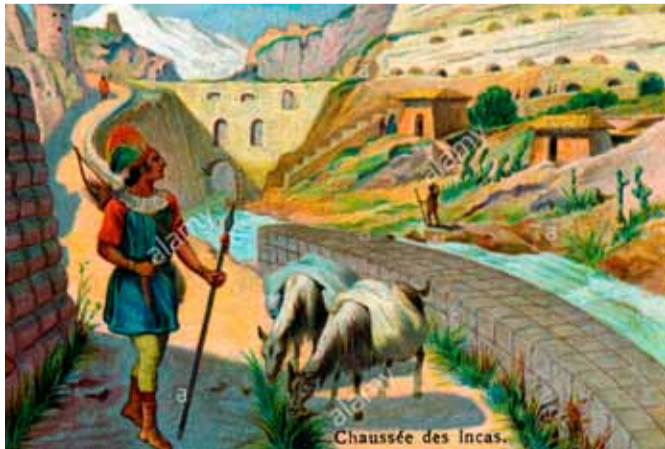
«Сцены исчезнувших королевств» Французская серия открыток. 1913

классов, жених надевал на правую ногу невесты изящную сандалию – нечто похожее на современную обувь; - индейская женщина рожала там, где начинался роды, сама перерезала пуповину и несла ребенка к ближайшему ручью, чтобы обмыть его. Воду роженица согревала у себя во рту; - хотя методы преподавания у инков и были авторитарными, телесные наказания обычно не применялись. Исключением являлись удары ладонью по ступне; - одежда инков была практичной и не предполагала индивидуальных различий. В день свадьбы люди получали от посланца правителя два комплекта одежды – один для праздников, другой для работы. Это был весь их гардероб на очень долгое время;