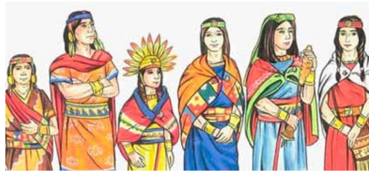
Костюмы инкского времени. Современная реконструкция

Обучение начиналось в возрасте примерно пятнадцати лет и длилось четыре года. Первый год в основном был посвящен изучению кечуа, то есть официального языка империи инков, второй — изучению религии, третий — изучению счета и