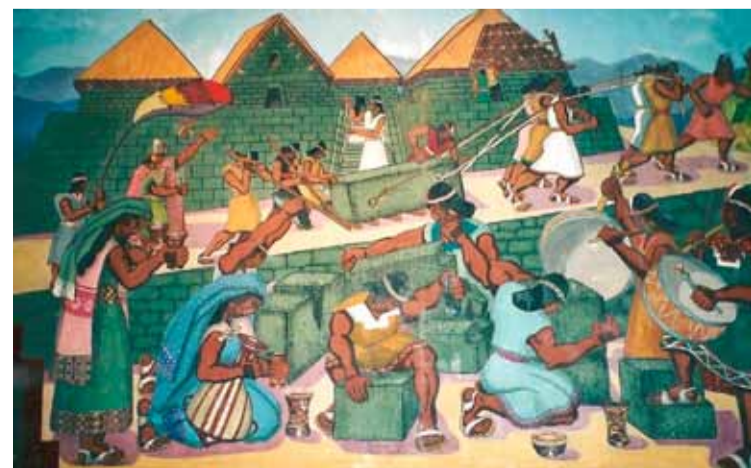
Строительство крепости. Современная реконструкция

Инки с их выраженным стремлением к организации определили, что должно происходить на каждом отрезке жизни. Возраст до двух лет считался младенческим. Конечно, родители занимались ребенком, играли с ним и следили за тем, чтобы он не упал и не обжегся. Второй период длился до пяти лет. Ребенок мог свободно играть или бегать за домашними животными. Затем игры прекращались и начиналось воспитание, основой которого служил пример родителей. Ребенка должны были «учить и растить в интересах королевства», как писал Пома де Айала.