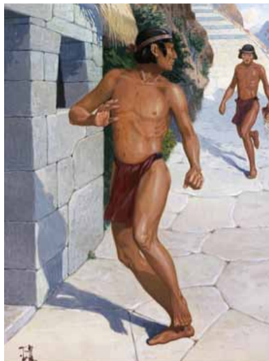
Гонцы-часки Современная реконструкция

Ничего невероятного в подобных сообщениях все же нет. Тренированный молодой человек, конечно же, в состоянии пробежать несколько километров со скоростью 17 км в час, а больше от перуанского бегуна и не требовалось – дальше, перехватив сообщение, бежал его товарищ. Как и когда возникла подобная система, определить сложно. Дороги, связывавшие отдельные долины и местности, появились в Перу задолго до инков. Вместе с тем на протяжении нескольких столетий, которые предшествовали эпохе инкских завоеваний, начавшихся в конце XIV века и в основном завершившихся через столетие, горные районы Центральных Анд переживали упадок. И-за постоянных войн и набегов многие земли были заброшены, а запертые в небольших городках на горных вершинах вожди со своими отрядами вряд ли были способны поддерживать порядок за пределами той небольшой территории, которую каждый из них контролировал.