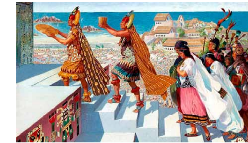
Основные богатства инков хранились в храмах, куда стекались золото и серебро со всего государства. Драгоценностями, скорее всего, обладали и представители высшей знати, чьи поместья располагались неподалеку от Куск. Современная реконструкция

- информация была закодирована в кипу – связках разноцветных шнурков с узелками. С помощью кипу можно было легко передавать данные, касающиеся числа определенных категорий предметов и объектов – тканей, людей, лам, разного рода продуктов и т.п. Однако ученые расшифровать кипу не могут, поскольку не известно, о чем именно «повествует» та или иная связка шнурков;